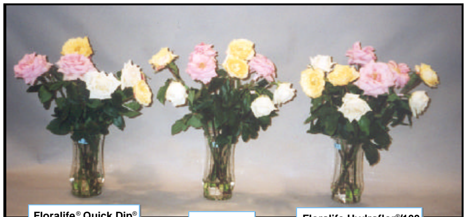
Floralife® Quick Dip®